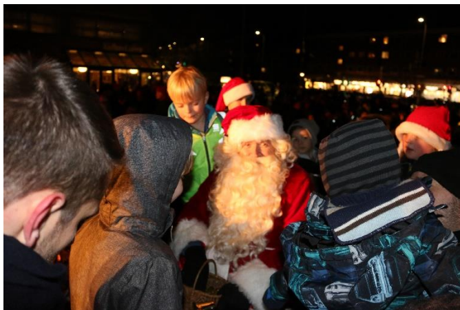
Julemanden på Rådhuspladsen 2019

Kultur, Fritid og Unge Gladsaxe Kommune December 2020